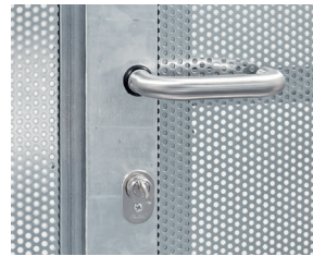
Wechselschloss mit Drückergarnitur