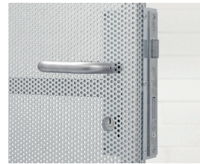
Kastenschloss mit Drückergarnitur