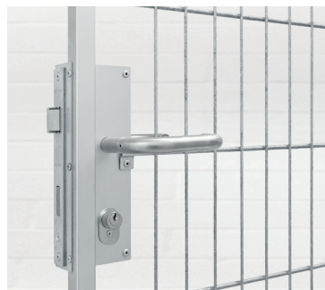
Kastenschloss mit Drückergarnitur